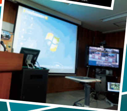
第8回原子力道場 TVセミナー講義風景